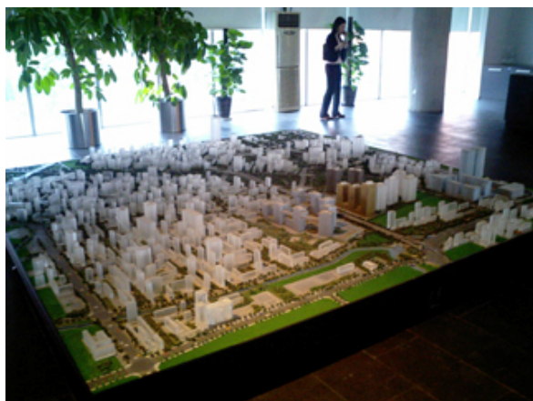
当代集団プロジェクト現場視察