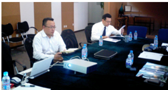
午前中の幹事会議（於・北京建王公司会議室）

更に、幹事会議で決定した大地震のお見舞い金についてもご理解いただき、懇親会場で一口100元の募金をお願いしたところ、多額の義捐金を頂戴しました。後日、日本側事務局にてとりまとめ、日中建協としての義捐金をお送りすることにしました。（別途、事務局として会員企業に義捐金を募ります。）